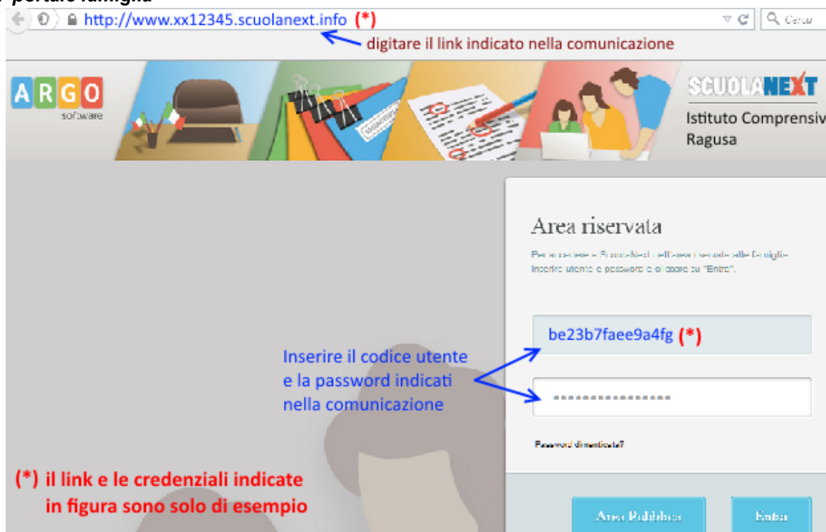
Fig. 2 portale famiglia

Basta avere un pc collegato ad internet, aprire il browser di navigazione ( consigliati mozilla firefox e google chrome ) e digitare o incollare il link indicato nella comunicazione.