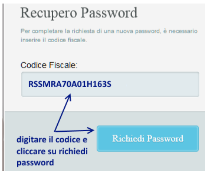
Fig. 7 recupero password ulteriore conferma digitazione del codice fiscale

Per una ulteriore verifica di sicurezza il sistema chiederà di digitare il codice fiscale dell'utente.